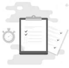
جدول (د) شرایط فراخوان - مقطع فوق لیسانس