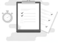
جدول (ج) شرایط فراخوان - مقطع لیسانس